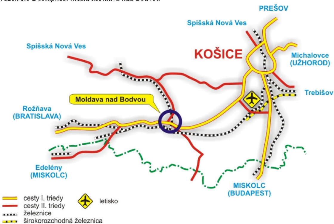
Obrázok č.1 Dostupnosť mesta Moldava nad Bodvou