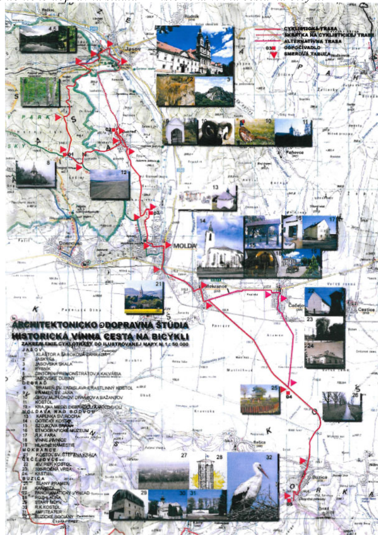
Obrázok 2 : Architektonicko dopravná štúdia – Historická vinna cesta na bicykli

cykloturistických trás sú aj cykloturistické značenia a informačné panely, ktoré by bolo potrebné rozmiestniť na trasách.