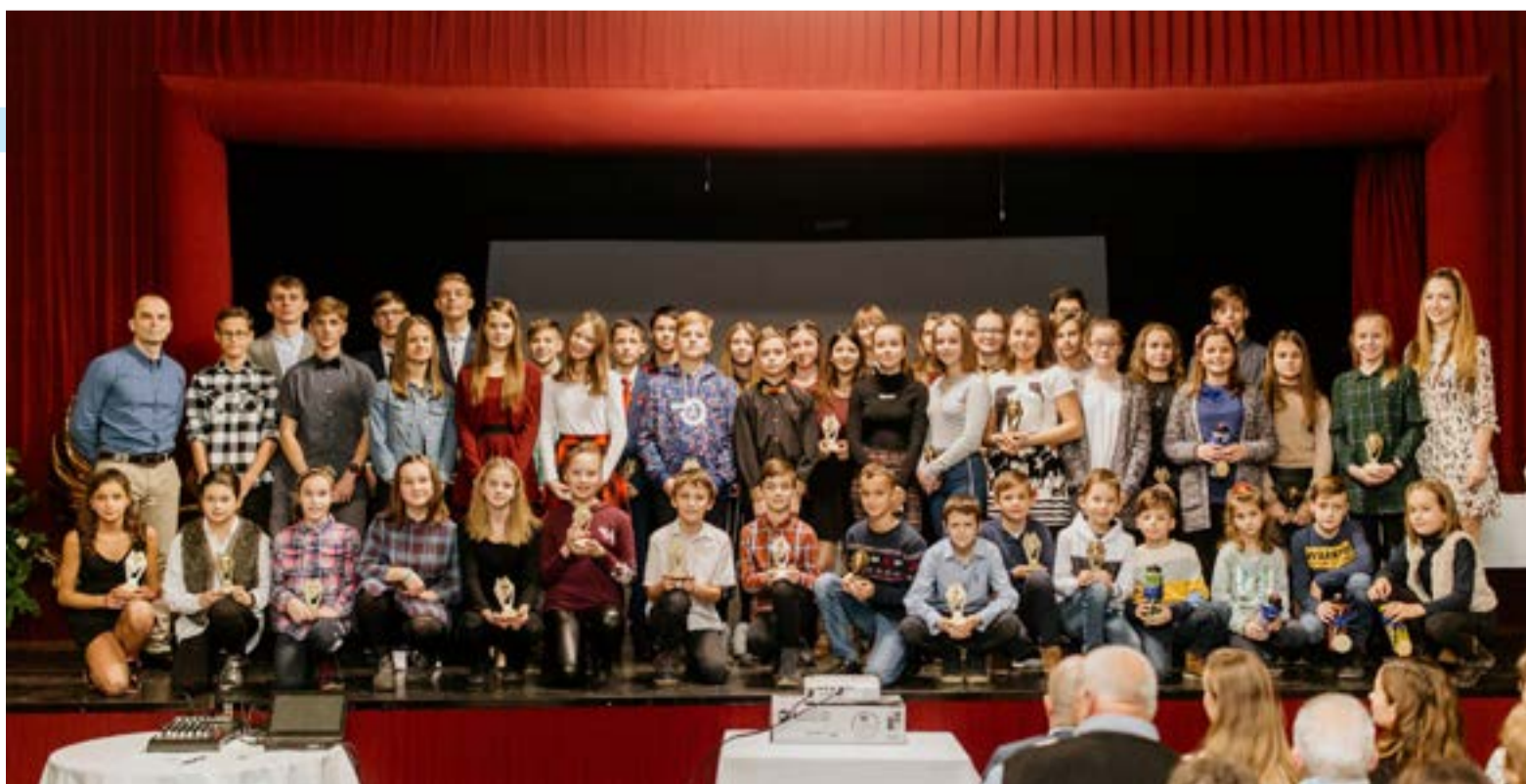
Az Athletic Legion Klub sikeres sportolói a 2019 decemberi díjátadón