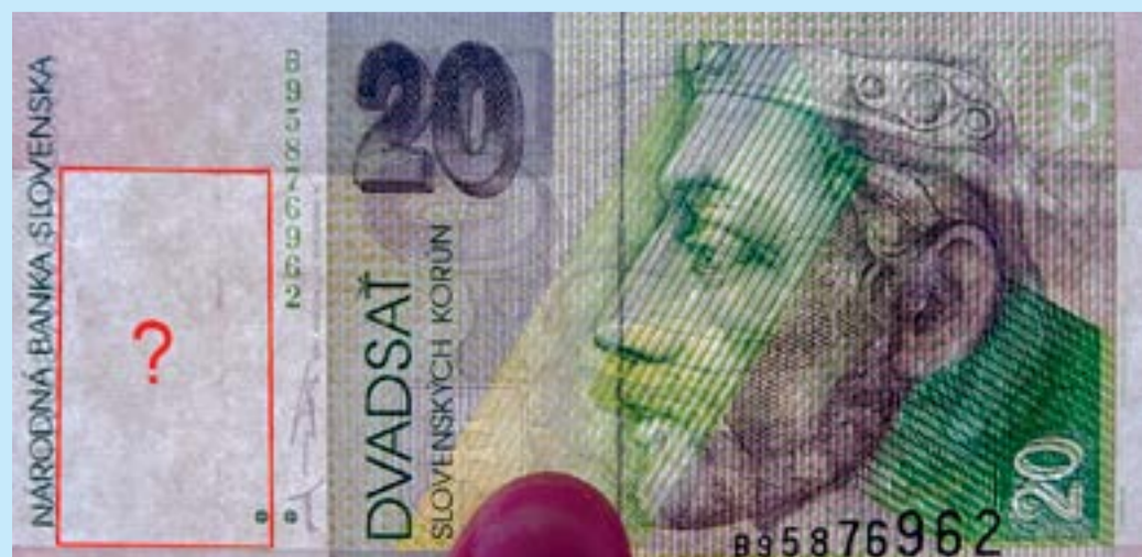
Szepsi „hamis koronák”