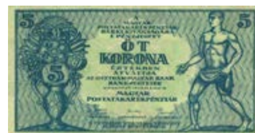
5 korún z roku 1919