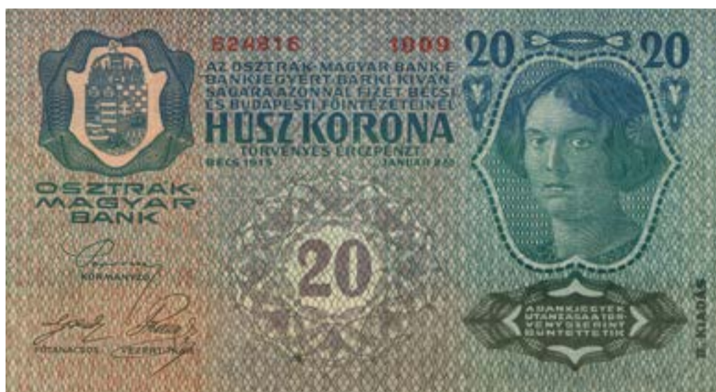
20 korún z roku 1913

spomínajú, že prechod na korunovú menu šiel veľmi ťažko a v krajine boli oblasti, ktoré sa novej mene prispôbovali veľmi ťažko. Kuriozitou je, že strieborné zlatky - forinty platili v Maďarsku až do roku 1927, do stiahnutia korunovej meny.