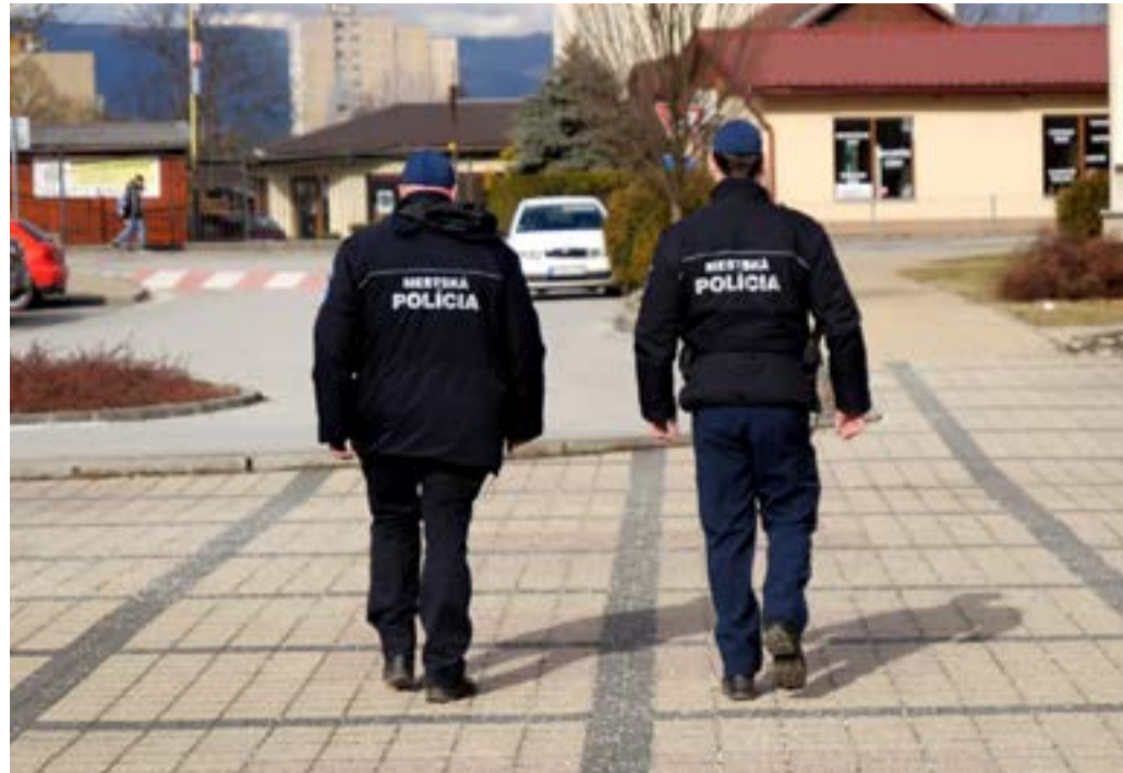
Príslušníci Mestskej polície počas hliadkovania

Hlavným cieľom je dostať policajta k občanovi, nech každý okrsk má svojho policajta. Mesto sme rozdelili do troch zón. Chce to aj viac propagácie, aby ľudia vedeli, kto je ich policajtom,