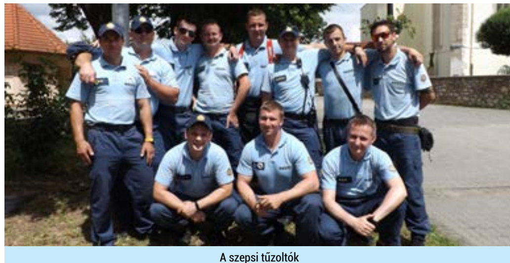
A szepsi tűzoltók