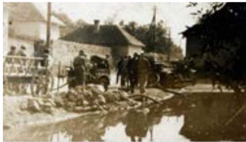
Az egykori szepsi tűzoltók gyakorlatozás közben a Dancka városrészen

A pannontuzvedelem.hu weboldal szerint már Augustus római császár, Kr. e. 21-ben parancsba adta, hogy szereljenek és képezzenek ki tűzoltásra (prefectures urbi) egy 600 tagú rabszolgacsoportot. Magyarországon pedig már I. Szent István király szigorú törvényt adott ki, amely többek közt rendeletben mentette fel a templomba járás alól a tűz őrzeit. Az első magyarországi önkéntes tűzoltóság a fent említett internetes oldal szerint a debreceni kollégiumban alakult meg. Ezek voltak az ún. éjjeli tűzőrök, vagy „vigilek”, akik háromórás váltásban őrizték „a kollégium álmát.” Később, az 1600-as évek vége felé részt vállaltak a városban (Debrecen) támadt tüzek oltásában is. II. József, a „kalapos király” 1788-ban országos tűzoltalmi intézkedéseket rendelt el. Ennek értelmében pl. minden ötvennél több lakost számláló községben kötelező volt tűzoltószertárat létesíteni. A 19. században, a már addig is az önkéntes tűzoltó egyletek létrejöttét szorgalmazó Széchenyi Ödön kezdeményezésére 1870. február 1-jén Pesten megkezdte működését a hivatásos tűzoltóság