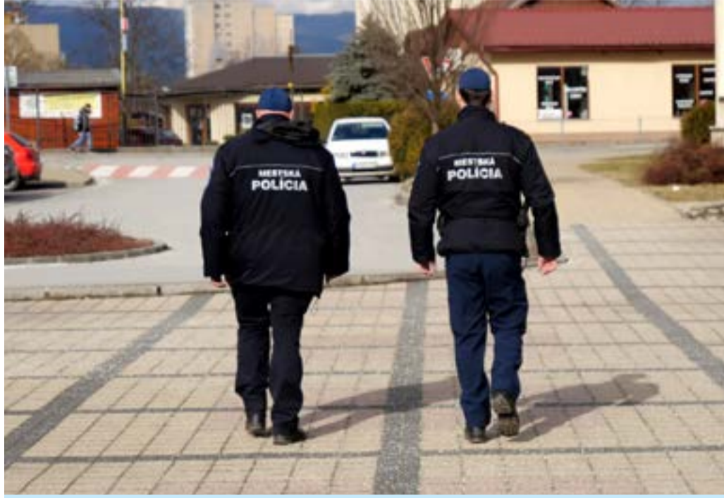
A városi rendőrök járőrözés közben

Megpróbálom beleélni magam a szepsi lakosok helyzetébe, ezért úgy gondolom, hogy nagyon nagy