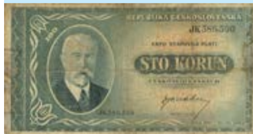
100 korona 1945-ből