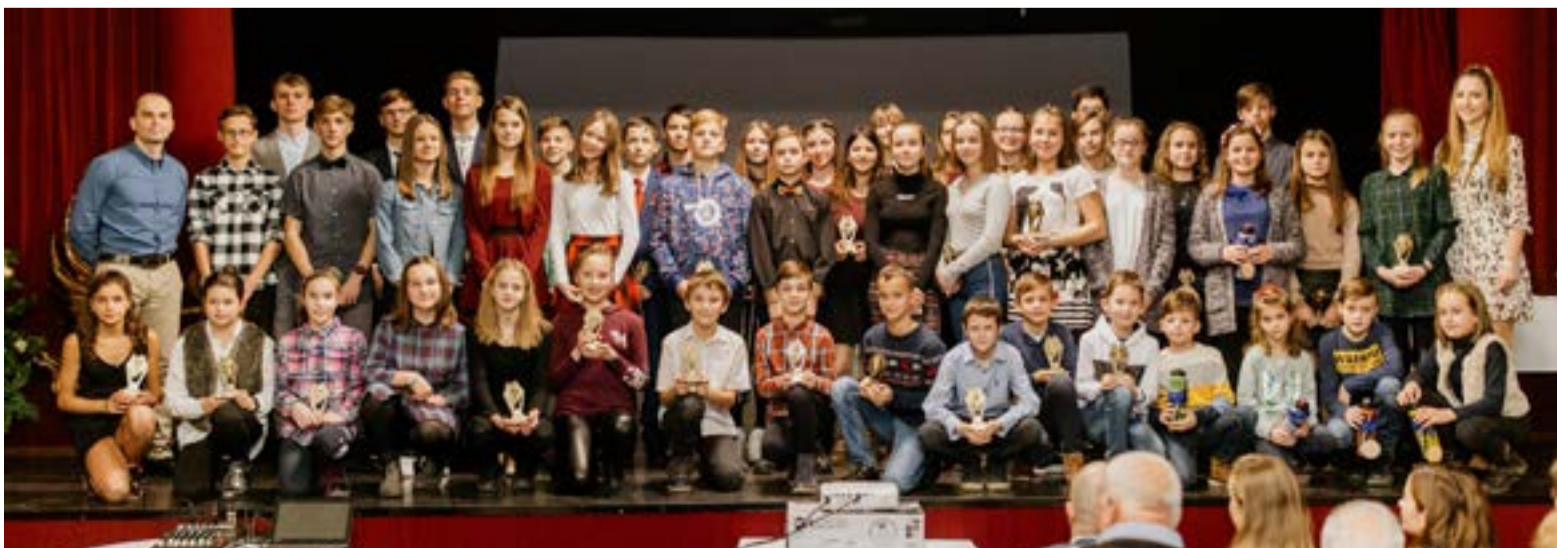
Úspešní športovci Atletického legionárskeho klubu počas Oceňovania športovcov v decembri 2019