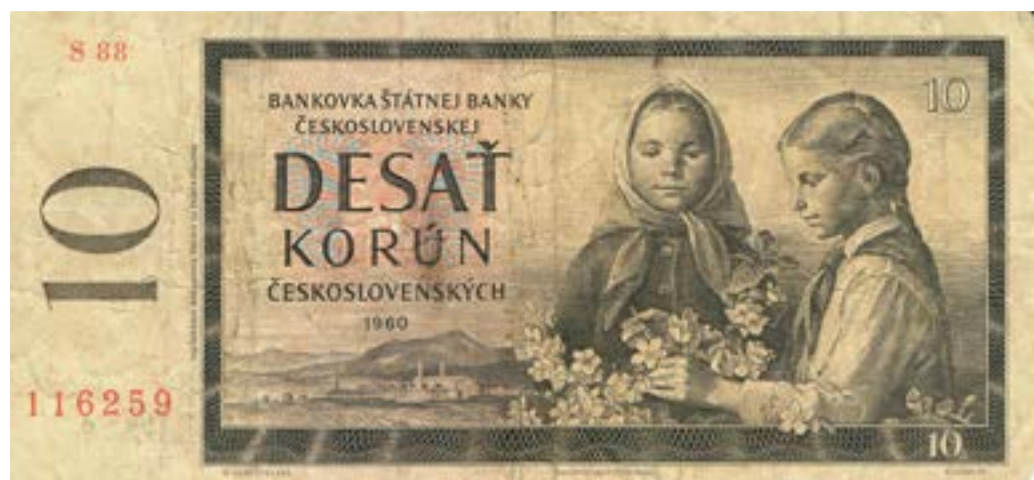
10 korona 1960-ból

A monarchia pénzváltásának világgazdasági okai voltak. A korábbi századokban ugyanis az egyes államok fokozatosan áttértek az aranyalapú valutafedezetre az ezüst helyett. A XIX. században, és már korábban is, világméretben megnőtt az ezüst kitermelése. Ez a jelenség károsan hatott az ezüstdfedezetű valuták értékére. A monarchia ebben a sorban szinte az utolsónak maradt. Sokáig kitartott az ezüstdfedezet mellett. Ugyanakkor özönlött be az ezüst az országba, és így az addigi fizetőeszköz, a forint egyre jobban leértékelődött. Valamit tenni kellett. Az akkori pénzügyminiszter Wekerle Sándor