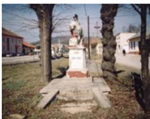
Socha sv. Floriána v Jasove