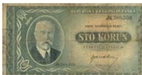
100 korún z roku 1945