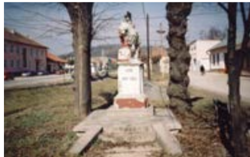
Szent Flórián szobor Jászón