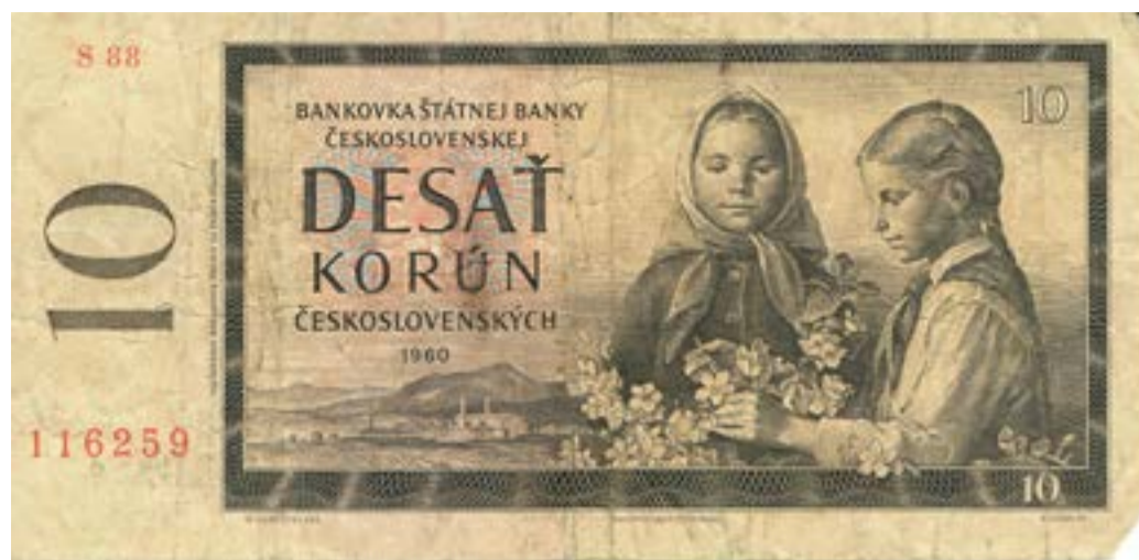
10 korún z roku 1960

Dôvody menovej reformy v monarchii boli globálne. V minulosti prechádzali jednotlivé štáty z krytia striebrom na krytie valút zlatom. Už pred a počas XIX. storočia celosvetovo vzrástla žažba striebra. Táto skutočnosť negatívne vplývala na hodnotu starých platidiel. Monarchia dlho vydržala pri krytí striebrom. V roku 1891 vtedajší minister financií Sándor Wekerle predložil návrh na menu krytú zlatom. V Uhorsku k tomu došlo v roku 1892 na základe Zákona číslo XVII. No ani po tom nebola situácia jednoduchá. Sťahovanie starých zlatiek z obehu trvalo až do roku 1900. Na stiahnutie zlatkových bankoviek bolo treba čakať do konca roku 1902. Dobové zdroje