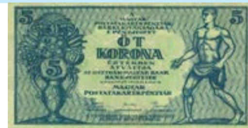
5 korona 1919-ből