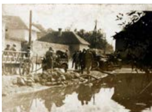
Cvičenie niekdajších moldavských hasičov v časti obce nazývanej Danca